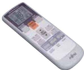
ASY 7 à 18 LCC cf. fonctions p. 34